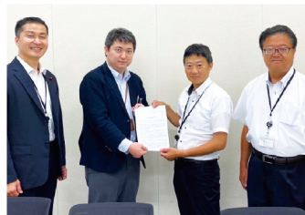
介護保険料の引き下げについて厚労省へ要望

A 1,000円引き下げるには、年80億円が必要。介護保険制度は、高齢者の介護を社会全体で支える社会保険制度であり、50%公費負担・50%保険料負担となるように制度設計されている。介護保険料を下げるために一般財源を投入するのは、適当ではないと国から見解が示されている。