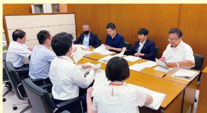
各局よりの施策説明