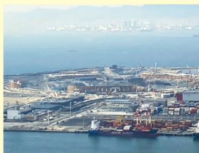
工事の進捗が遅れている万博会場