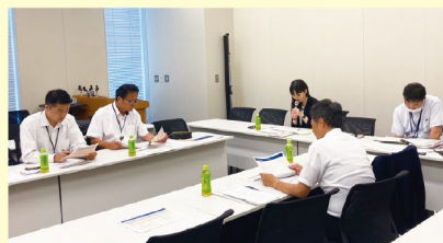
国からの施策説明(東京の衆議院議員会館会議室)