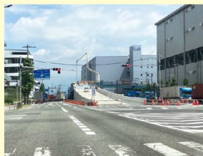
舞洲で工事している万博での渋滞緩和のバイパス