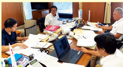
議員団会議(毎週火曜日開催)

議員団でどのように課題に取り組んでいくか協議し、施策の現状を各局また国からヒアリングしていきます。