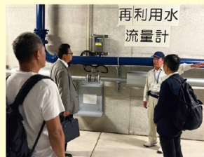
広島市大州雨水貯留地